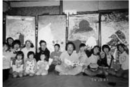
ふすま絵「四季」を囲んで

地域の世代を超えた人と人のつながりを生む、地域からの文化・情報の発信地として、これからも地道なあゆみをつづけていきたいと考えています。