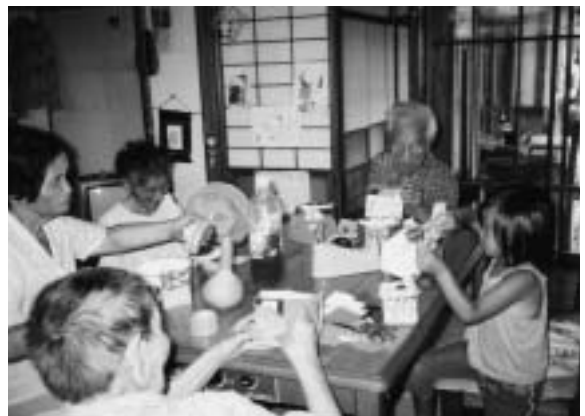
みんなで創作活動

我々の事業に賛同いただける方、ぜひ会員になってください。また、会員を増やすいいアイデアがあれば、ぜひ教えてください。