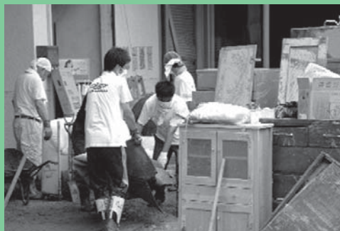
家財道具の整理運搬