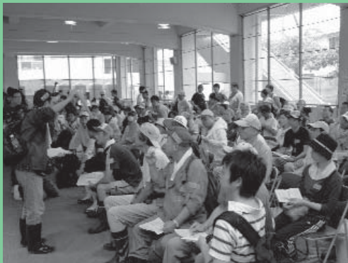
ボランティアのマッチングの様子

阪神・淡路大震災からまもなく15年となりますが、兵庫県ではボランティアの精神や助け合いの精神が確実に根づいていることがうかがえます。