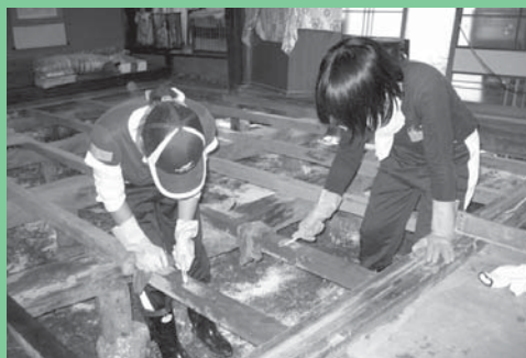
大学生らによる屋内のふき掃除