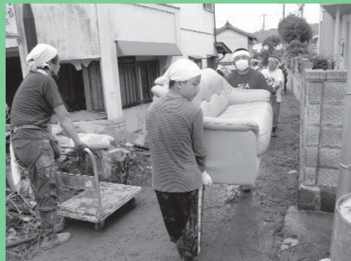
家具などの運び出し