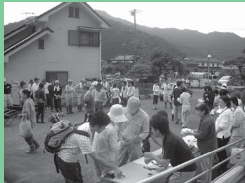
ボランティア受付風景