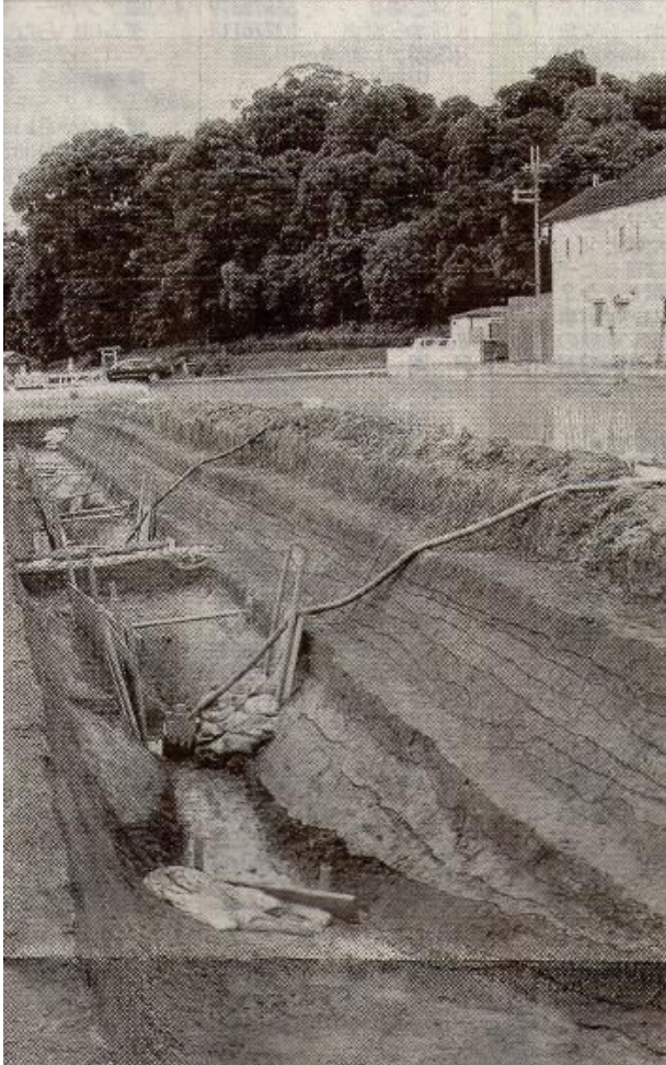
周濠の一部の落ち込み状遺構。古墳前方部（奥）に向かって広がっていた 11月6日、奈良県桜井市