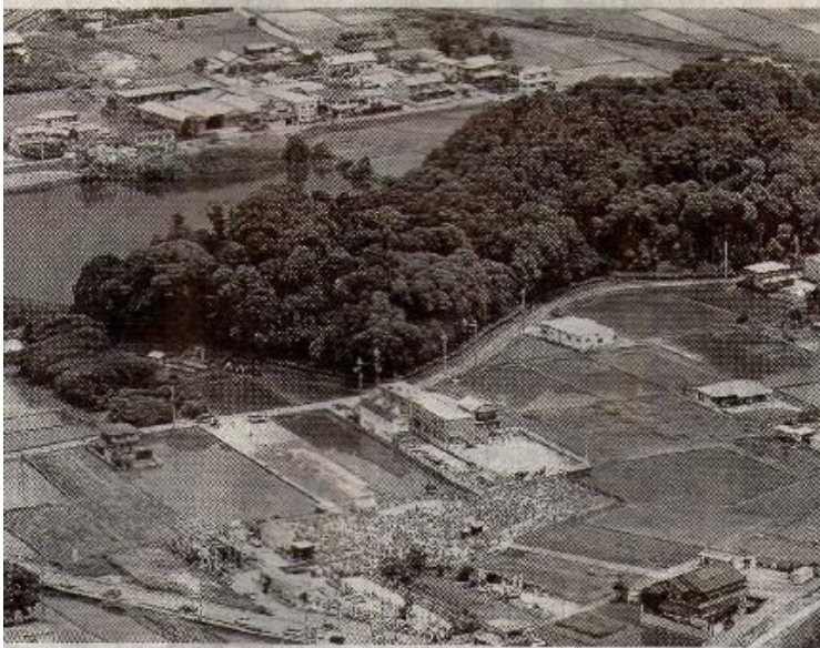
大規模周濠の存在が初めて確認された箸墓古墳と発掘現場（中央下） 6月、奈良県桜井市

は、研究者によって数十年の開きがあり、いまだに論争の決着には至っていない。ただ今回、被葬者の強大な力リスマ性を物語る大規模周濠が確認されたことをきっかけに、被葬者論争はさらに高まりそうだ。