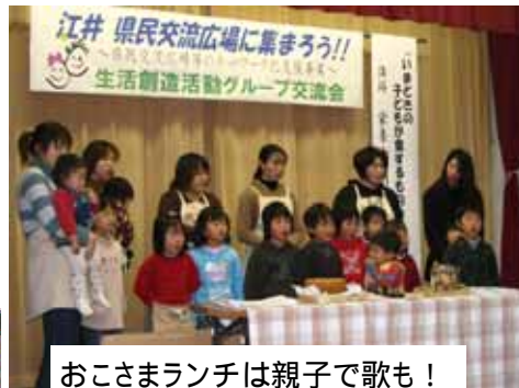
おこさまランチは親子で歌も！