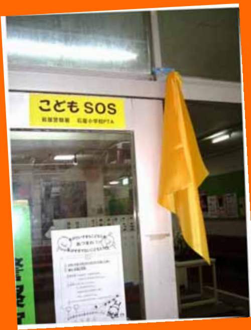
通学路守る「幸せの黄色いハンカチ」

子どもを取り巻く環境が悪化の一途をたどる今日、子どもを守る運動は各地で盛んに行われております。去年1年間では、岩屋・津名西・洲本署管内合わせて約25件もの子どもに対する声かけ等の事犯が発生しているそうです。地域の保護者などは一斉に危機感を募らせ、その対応に走りまわっている中で、岩屋では、即対応・即実行型の「は～い!こちら岩屋防犯グループです。」というグループが立ち上がり、防犯パレードをはじめとする活動を実践しています。また、石屋小学校PTAを中心に『こどもSOS』運動がスタートし、保護者が、危険と思われる区域の家庭を訪問し、こどもSOSシールと黄色いハンカチを配布し、在宅時は黄色いハンカチを必ず玄関に取り付けていただいて、目印としての機能を強化しました。後日、一斉下校時に先生方をはじめ、保護者や防犯グループのメンバーが同伴して協力家庭を訪問し、子どもとの顔合わせをしました。この運動は、「子どもへの目印と町の防犯意識を高める。」という意味もありますが、「犯罪をおこしにくい、おこさせない環境づくり。」を目的としています。