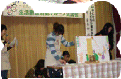
手づくり紙芝居「くまさんアイス」