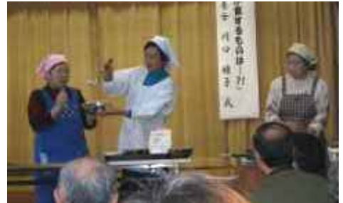
食文化研究会は、ちぢみの作り方実演をしました。

2月19日(日)晴れ 江井コミュニティセンターは、子どもたちや江井地区の皆さん、生活創造活動グループが集合、話して、踊って歌って食べての交流、とてもとても賑やかでした。