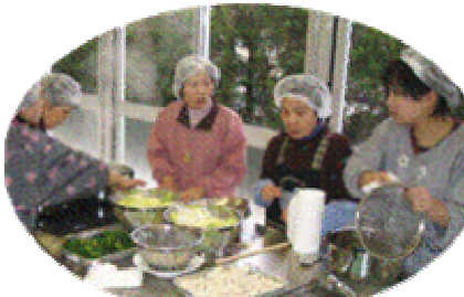
試食の調理はいずみ会の皆さんが担当