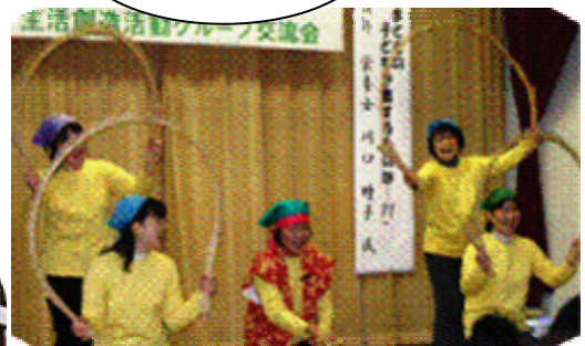
淡路おやこネットワークばんぼこ 得意技は、南京玉すだれ～！