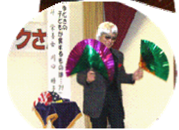
淡路まじっくさんの手品