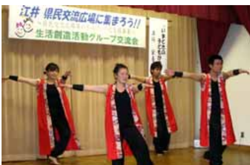
魂～kon～のよさこい踊りで会場は大盛況！