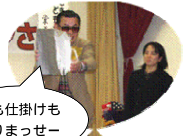
種も仕掛けもありませー