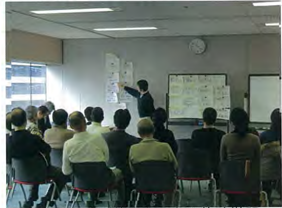
グループ運営ノウハウの体験学習